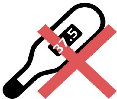
お客様自身の体調チェック