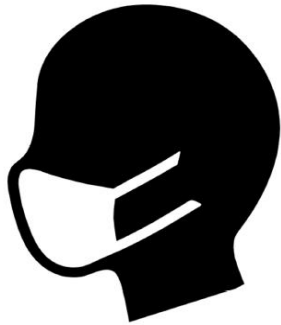
従業員のマスク着用推奨