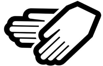
定期的な手洗い、手指消毒