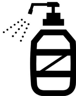
手指消毒液の設置