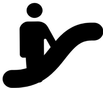
こまめな館内設備の消毒